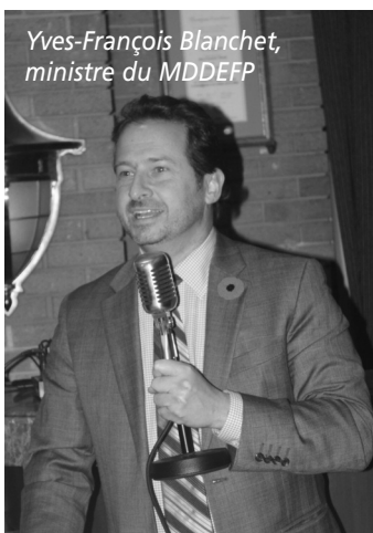
Yves-François Blanchet, ministre du MDDEFP