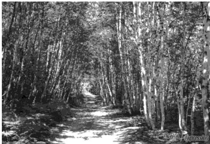
Ce sentier en pleine nature, qui s'étend sur plus de 160 km, relie les zecs Collin et Boullé.

Une douzaine de patrouilleurs sillonneront le sentier pour assurer la sécurité des usagers et des endroits permettant d'utiliser les téléphones cellulaires Telus seront aussi ciblés.