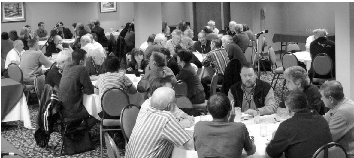
Atelier Chasse à l'original

Nous sommes convaincus que ce petit texte vous a fait sourire! Dans le prochain bulletin, nous ferons un bilan des diverses méthodes utilisées par les zecs afin de gérer et structurer la chasse à l'original.