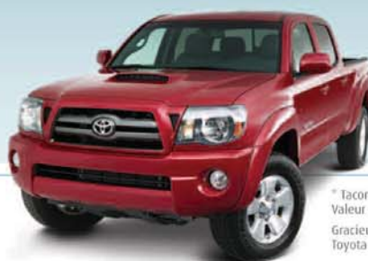
Lot vedette: le Tacoma 2009*.

* Tacoma 2009 4x4 à cabine Accès. Valeur approximative de 26 000 $ Gracieuseté de l'Association des concessionnaires Toyota de la grande région de Québec