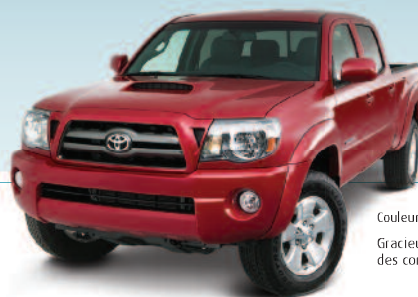
LOT VEDETTE Tacoma 2010 4x4 à cabine double d'une valeur approximative de 36 000 $.

Cet espace publicitaire a été offert par Zecs Québec, partenaire de l'Encan faune et nature Toyota.