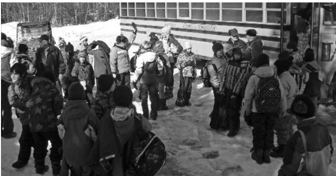
Groupe de jeunes initiés à la pêche pendant la relève 2010.

Grâce au programme Jeunesse Nature de la Société beauceronne de gestion faunique incorporée (SBGF) appuyée financièrement par le programme de réinvestissement dans la faune 2010-11 du Ministère des Ressources naturelles et de la Faune, la zec Jaro en Beauce initiera gratuitement 400 jeunes à la pêche sur la glace lors de la prochaine saison hivernale.